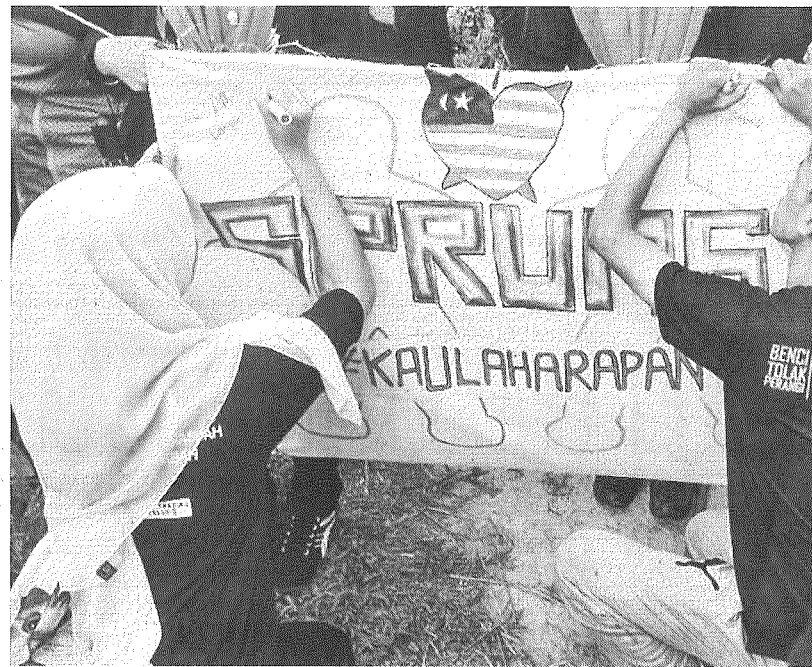
AHLI SPRUMS mengambil bahagian dalam aktiviti yang diadakan.

Katanya, kemahiran insaniah sebegini sangat dititikberatkan kepada semua pelajar.