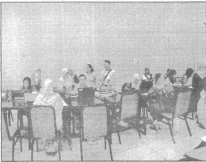
DAFTAR DIRI... Suasana di bilik pendaftaran para pelajar.