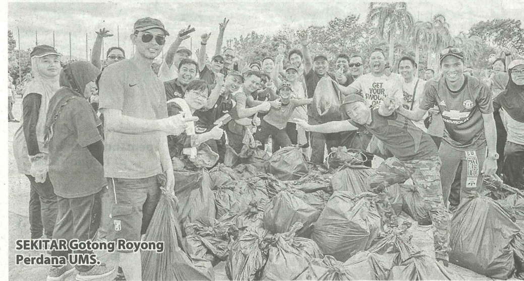
SEKITAR Gotong Royong Perdana UMS.

Pada program itu, Zon 3 yang terdiri daripada kawasan Fakulti Kejuruteraan, Fakulti Sains dan Sumber Alam, Fakulti Sains Makanan dan Pemakanan, Suksis, Jabatan Pembangunan dan Penyelenggaraan, Pusat Rawatan Warga, Pusat Sukan, Palapes, Fakulti Perubatan dan Sains Kesihatan, Pusat Pengajian Pascasiswazah, Bahagian Perkhidmatan Akademik dan Kolej Kediaman