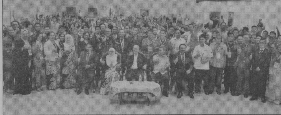
KENANGAN... Bergambar kenangan, para peserta seminar dan kakitangan kolej kediaman serta unit perumahan yang hadir dalam seminar kelmarin.