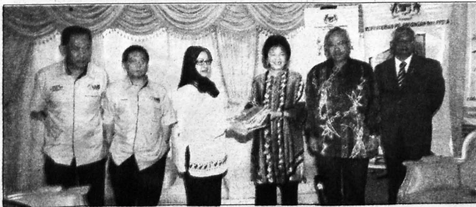
BUKU PELANCONGAN ... Dr. Ng Yen Yen (tiga, kiri) menyerahkan buku pelancongan kepada wakil dari perpustakaan UMS.

"Semua ini adalah langkah ke hadapan bagi industri pelancongan di Malaysia di bawah Pelan Transformasi Pelancongan Malaysia (NTTP)," katanya.