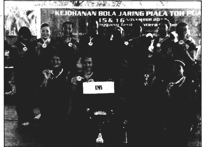
PASUKAN UMS bersama Pengurus Pasukan dan Jurulatih.