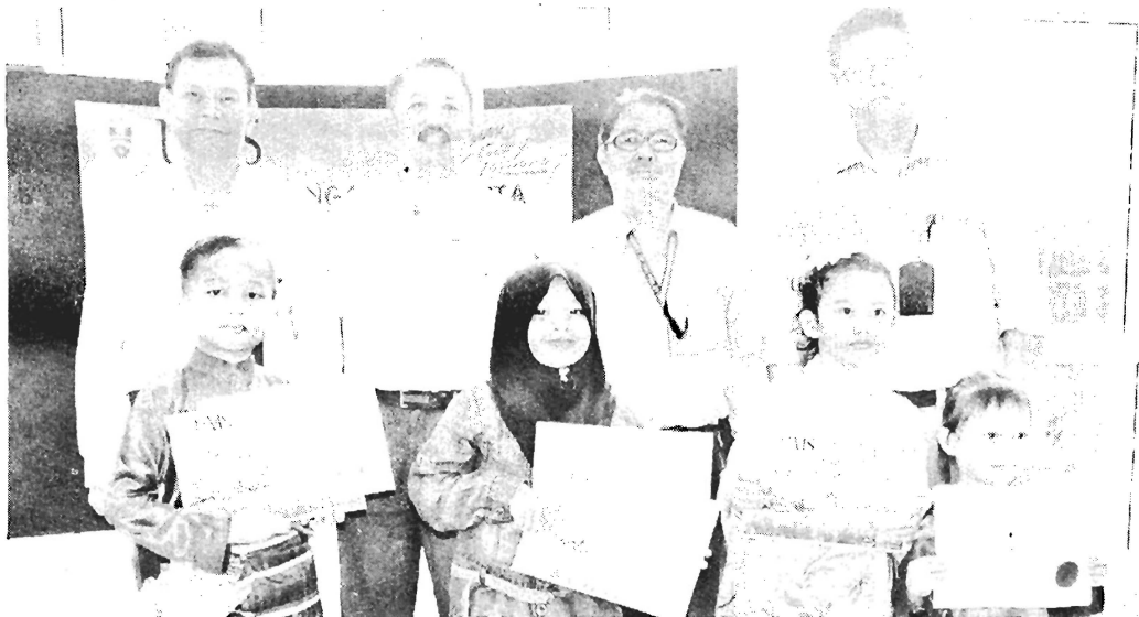
PARA pemenang pertandingan bercerita bergambar bersama juri dan penganjur.

menampilkan cerita peserta berasaskan kepada cerita-cerita rakyat Malaysia yang mengandungi unsur-unsur pengajaran dan nilai-nilai murni sejagat yang tidak menyentuh isu politik, bangsa dan agama.