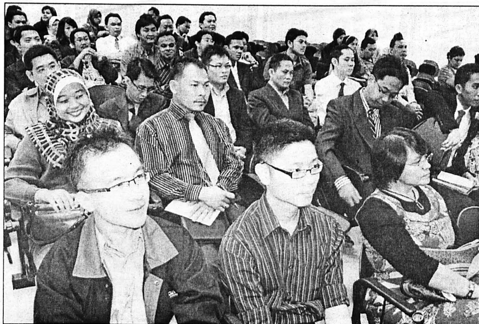
SERTAII .... Sebahagian pensyarah SPKAL dan SSIL yang menghadiri taklimat Etika Akademik.