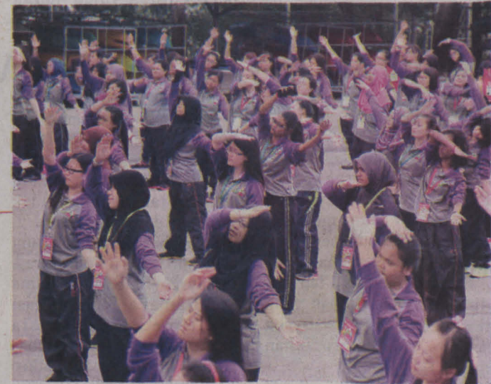
(Kanan) SEBAHAGIAN pelajar perempuan yang menyertai senamrobik di perkarangan letak kenderaan UMS Labuan.

pelajar baharu itu mencipta formasi MSM UMS 20 sebagai simbolik penyatuan dalam kalangan warga universiti yang terdiri daripada pelbagai bangsa dan agama dari seluruh negara serta pelajar antarabangsa dari China.