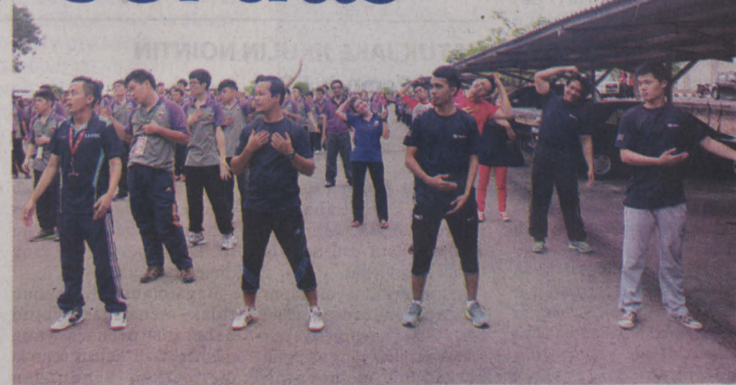
(Atas) PEGAWAI dan kakitangan turut menjayakan senamrobik bersama pelajar baharu.

Sebelum program senamrobik itu berakhir,