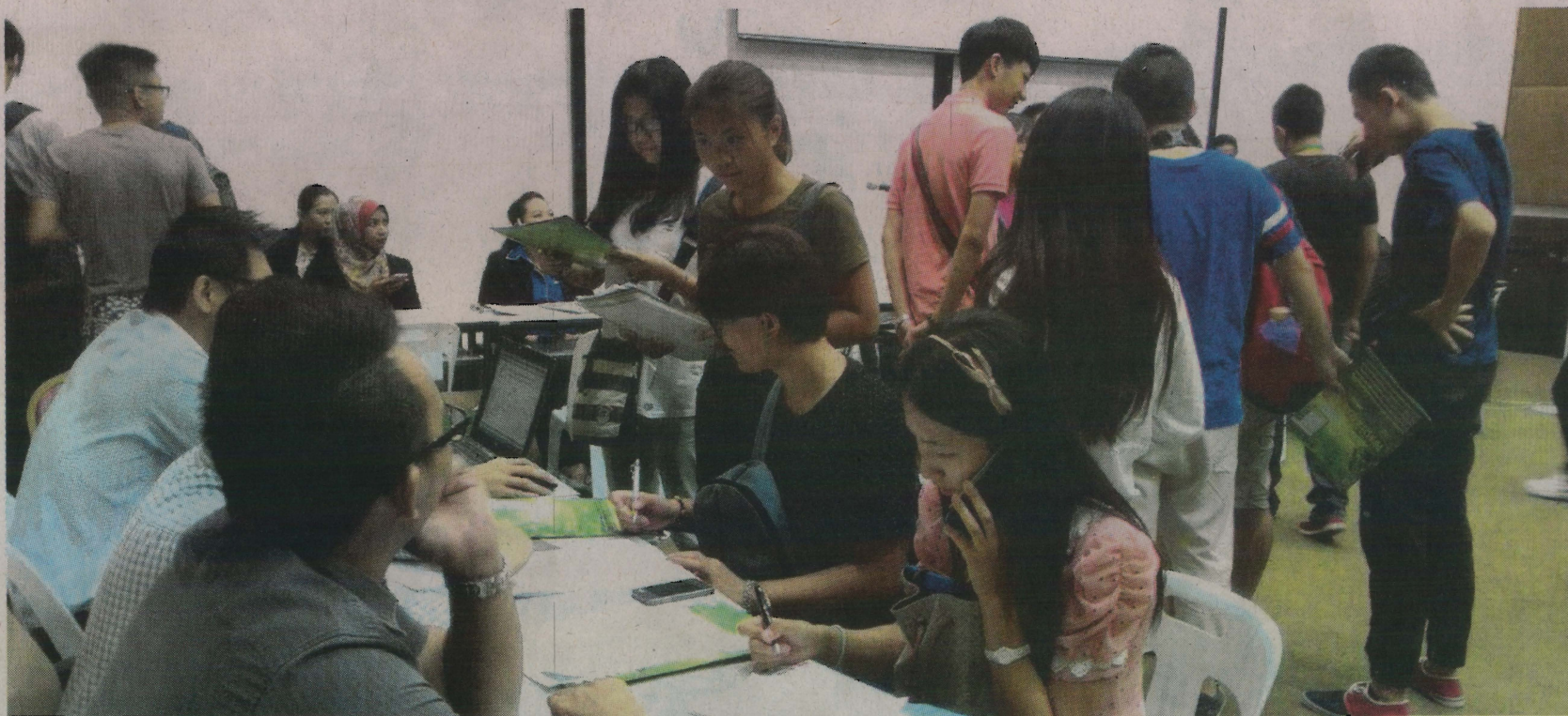
BEBERAPA petugas (kiri) terdiri daripada mahasiswa dan kakitangan UMS membuat persiapan terakhir untuk majlis Minggu Suai Mesra di UMS, Kota Kinabalu, semalam.

Minggu suai kenal UMS berlangsung seminggu sehingga 7 September ini dengan pelbagai pengisian menarik yang bakal mempersiapkan fizikal dan mental para penuntut baharu supaya meneruskan kecemerlangan.