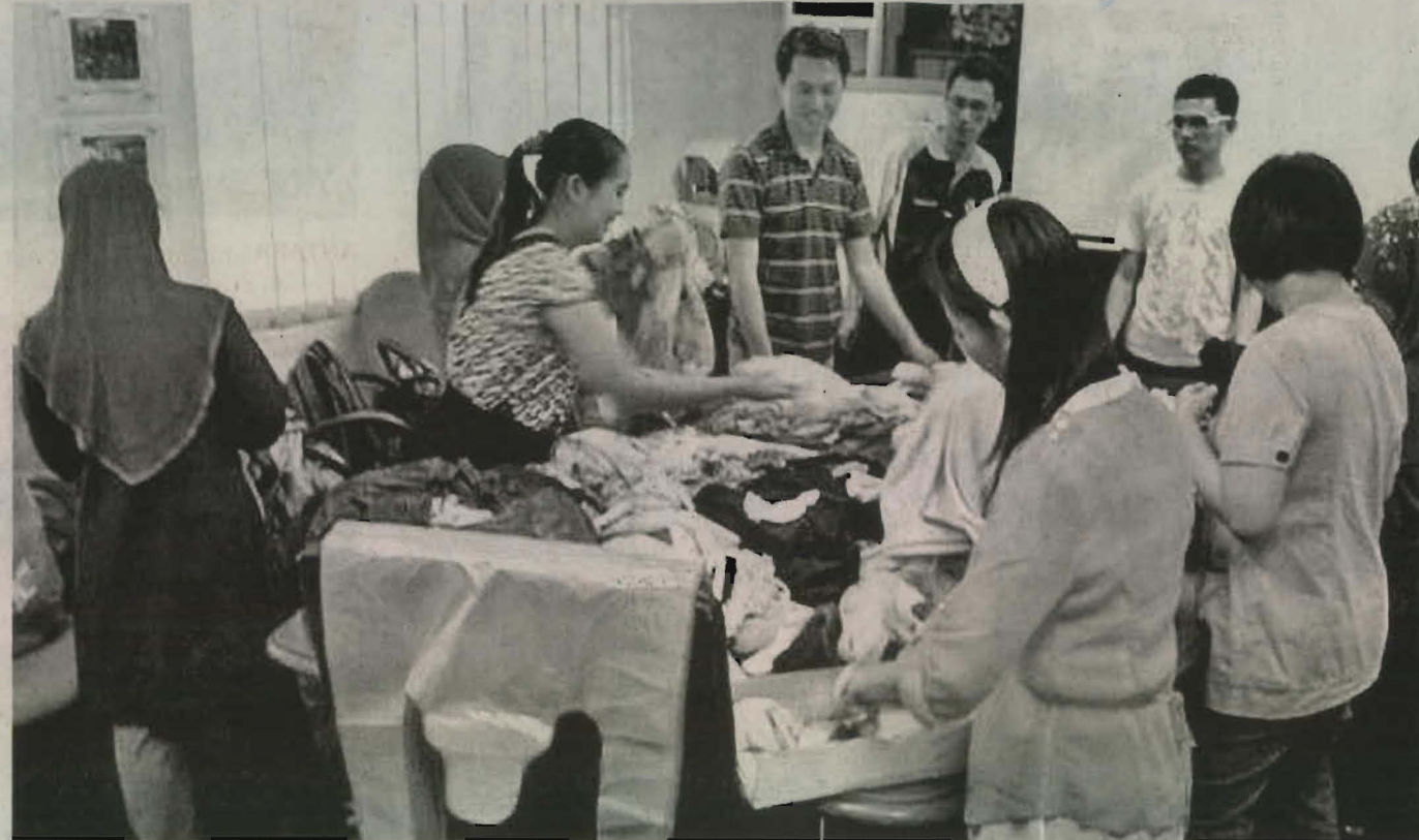
PARA peserta dari Unit Penyelidikan Luar Bandar UMS bersiap ke Pulau Banggi.

Katanya, Mahasiswa Unit Penyelidikan Luar Bandar UMS akan turut menjalankan aktiviti kemasyarakatan berbentuk pendidikan yang dijangka mampu memberi pendedahan mengenai peri pentingnya pendidikan lestari, khususnya di kawasan pulau itu. Program itu