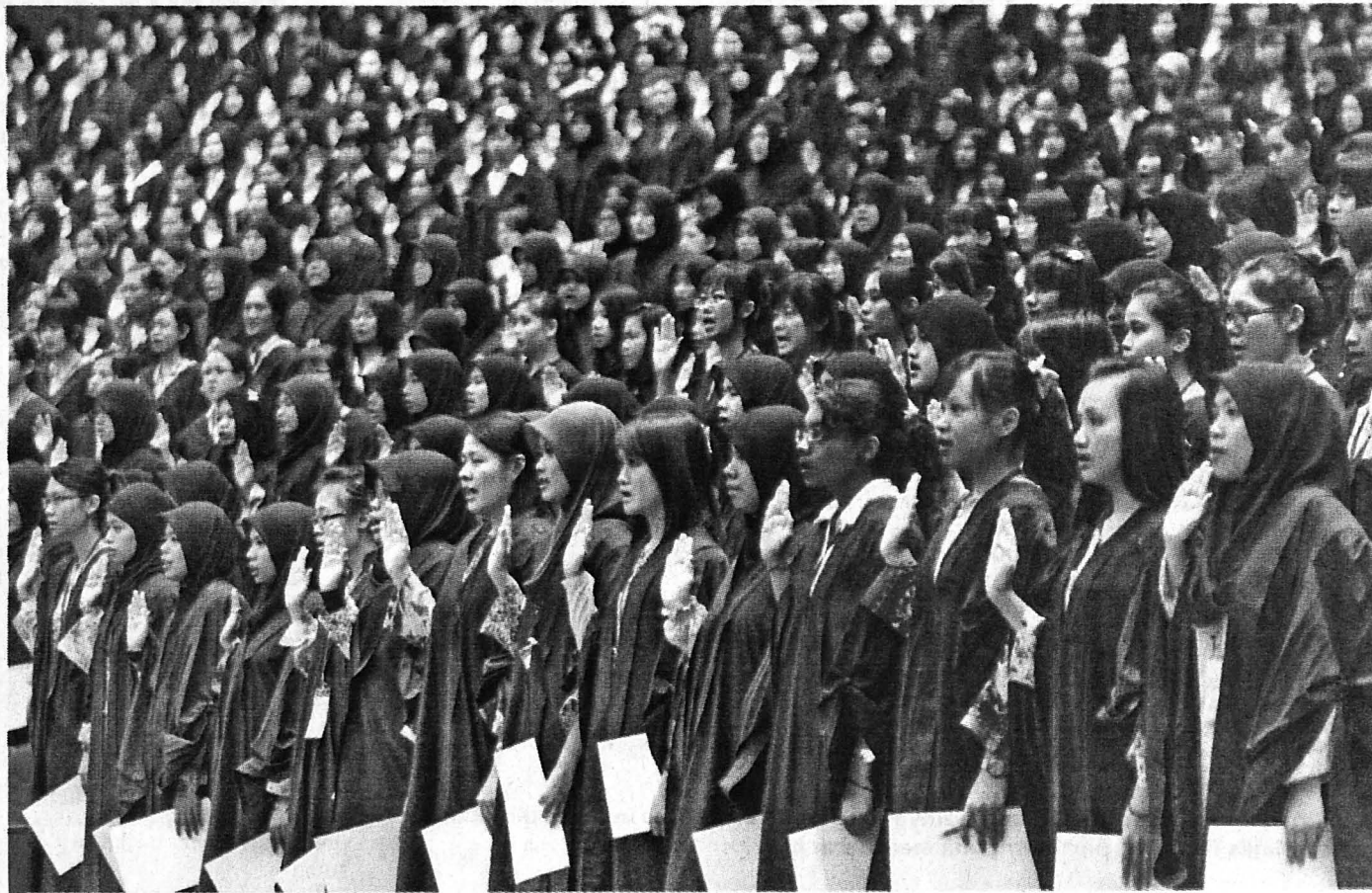
IKRAR AKU JANJI ... Sebahagian daripada mahasiswa baru UMS mengangkat sumpah dan ikrar Aku Janji di Dewan Canselor UMS, kelmarin.