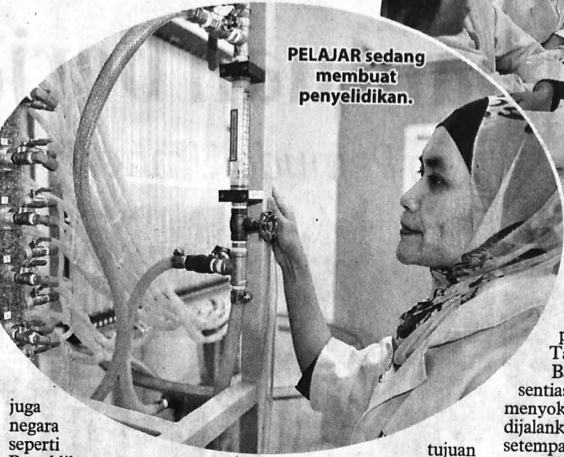
PELAJAR sedang membuat penyelidikan.