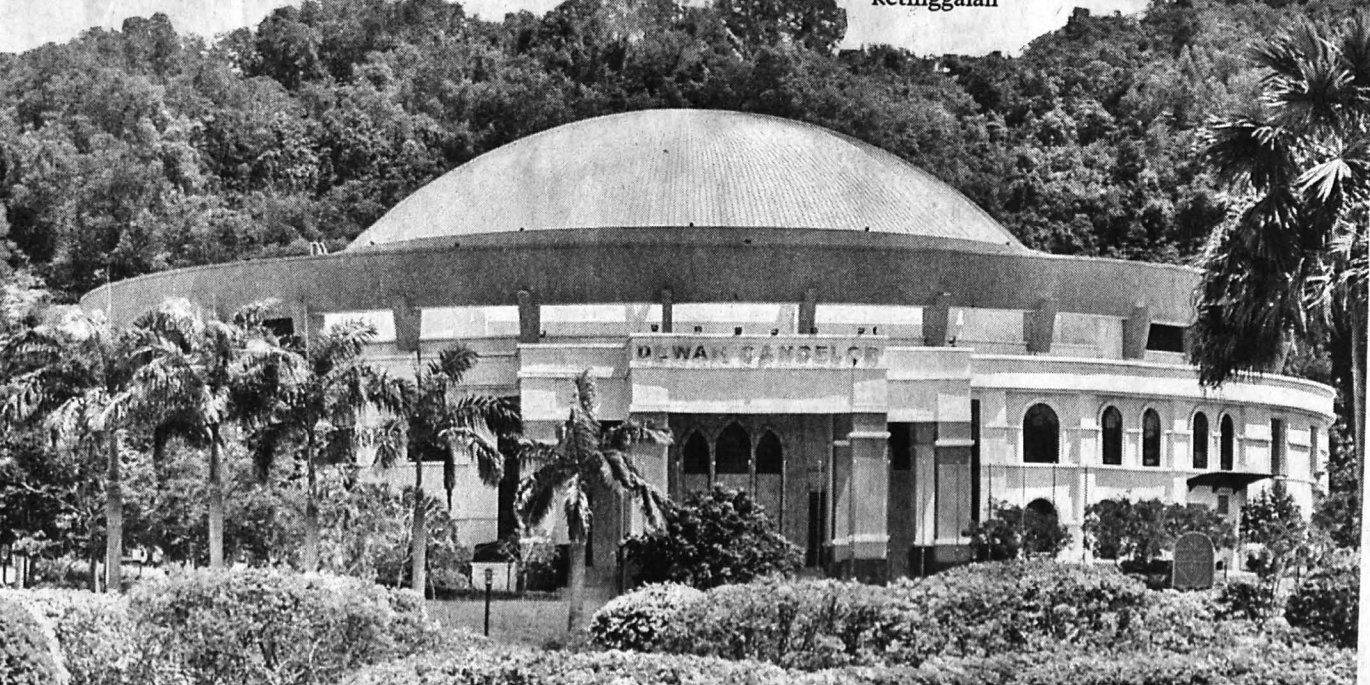
(Gambar kanan) BANGUNAN Canselori dan Dewan Canselor.