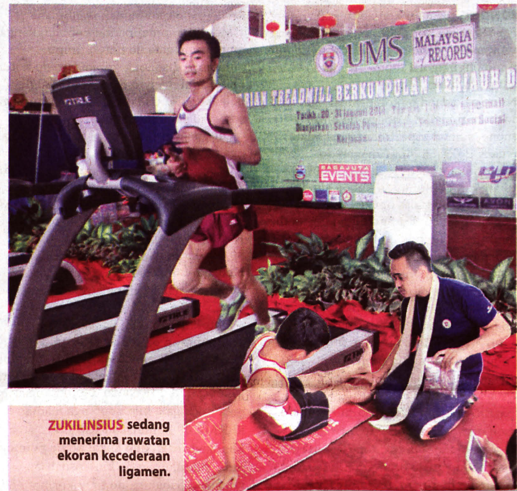
ZUKILINSIUS sedang menerima rawatan ekoran kecederaan ligamen.

hasrat pelbagai pihak terutamanya kedua ibu bapa yang sentiasa memberikan sokongan.