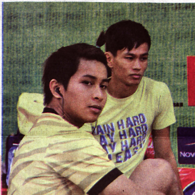
PESERTA sedang menunggu giliran untuk meneruskan larian seterusnya.

Larian yang melibatkan lapan orang atlet lelaki dan seorang wanita itu akan diteruskan sehingga 31 Januari ini (Jumaat).