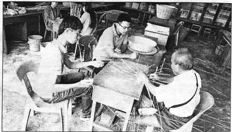
KHIDMAT MASYARAKAT... Pelajar UMS mengadakan khidmat masyarakat.

Sesungguhnya, perjalanan UMS yang pada awalnya hanya sekadar impian, kemudian lahir dengan status menumpang, sebelum berdiri gagah di Teluk Sepanggar, nyata memberikan impak besar dalam pola sosio-ekonomi dan pendidikan masyarakat di negeri Sabah. UMS akan terus bertekad cemerlang sebagai pusat penyebaran ilmu dalam membangunkan modal insan seiring pemeraksanaan penyelidikan yang berimpak tinggi. Sumber yang ada dikaji, ilmu di minda dikongsi, teknologi yang ada diinovasi sekali gus merobah idea menjadi realiti.