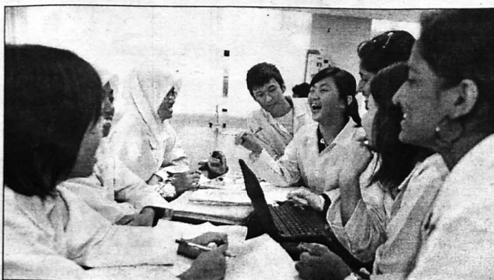
SERONOK... Pelajar membuat penyelidikan beramai-ramai.