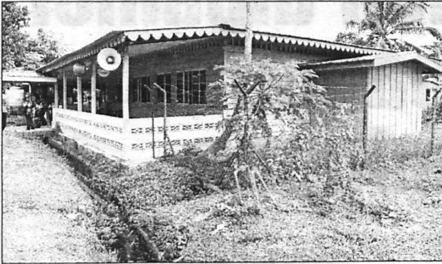
SURAU ... Surau Ag. Taha, Kampung Binsulok tempat penduduk kampung mengerjakan ibadah.