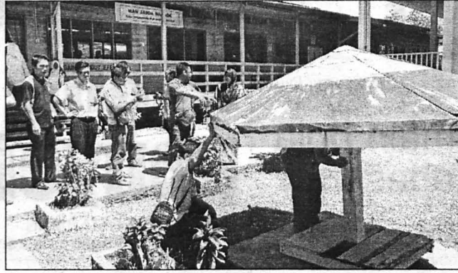
AKAN DIBAIK PULIH ... Salah satu infrastruktur yang perlu dibaik pulih.

BUDAYA memucang-mucang atau bergotong royong secara sukarela adalah amalan yang sinonim dengan masyarakat Brunei di Sabah sejak dahulu lagi.