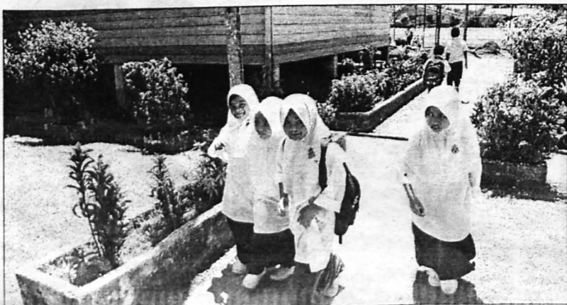
PELAJAR RENDAH ... Murid-murid ke sekolah menuntut ilmu.