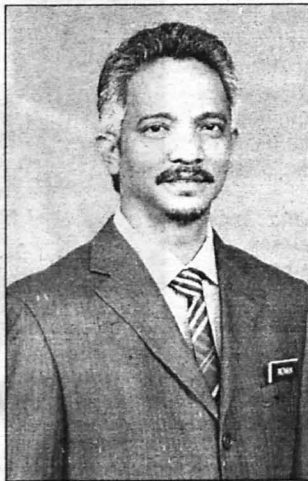
NO'MAN ... Ketua Jabatan Canselori UMS.

Melihat kepada senario tersebut, UMS sebagai sebuah institusi pengajian tinggi harus memainkan peranan 'mendidik' dalam mengembalikan semula tradisi tersebut. Hal ini perlu bagi memastikan elemen keprihatinan dan bersatu padu