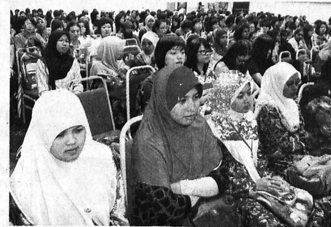
HADIR...Sebahagian pelajar perempuan Tahun Satu yang menghadiri Taklimat Akademik sesi 2011/2012.