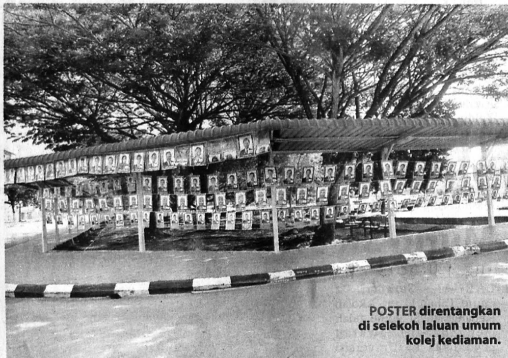
POSTER direntangkan di selekoh laluan umum kolej kediaman.