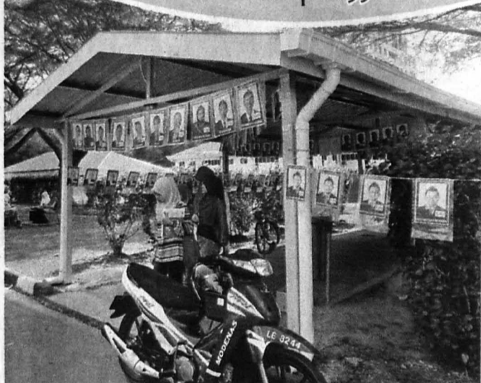
CALON-CALON bertanding dari Sekolah Sains dan Informatik Labuan.

“ Dalam siri kempen, kelihatan ada di kalangan calon-calon bertanding mengambil posisi di laluan utama kampus untuk berucap salam dengan kalangan pelajar yang lalu-lalang di samping bertukar pesan dan mengucapkan terima kasih atas sokongan. Suasana pilihan raya kampus UMSKAL menampakkan proses pemilihan sama seperti yang dijalankan dalam pilihan raya umum Malaysia dengan penggunaan pelbagai peraturan berkaitan pemasangan poster dan pengetengahan isu-isu kempen. ”