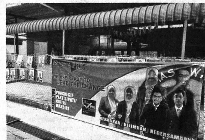
(Gambar kanan) CALON-CALON bertanding dengan slogan kempen mereka.