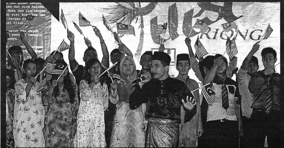
Pelajar Universiti Malaysia Sabah (UMS) menyampaikan lagu Kemerdekaan pada Malam Puisi Riong sempena 50 tahun Sabah Maju dalam Malaysia.