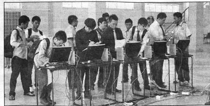
DAFTAR MELALUI TALIAN... Pelajar baharu sedang mendaftar secara talian di dewan kolej CD.