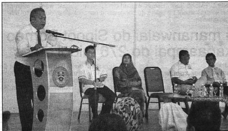
UCAPAN ALU-ALUAN... Timbalan Naib Canselor Penyelidikan dan Inovasi menyampaikan ucapan alu-aluan kepada para ibu bapa.

Beliau berkata pihak kolej kediaman CD telah menyediakan kemudahan serta keselamatan yang terbaik di antara semua kolej ke-