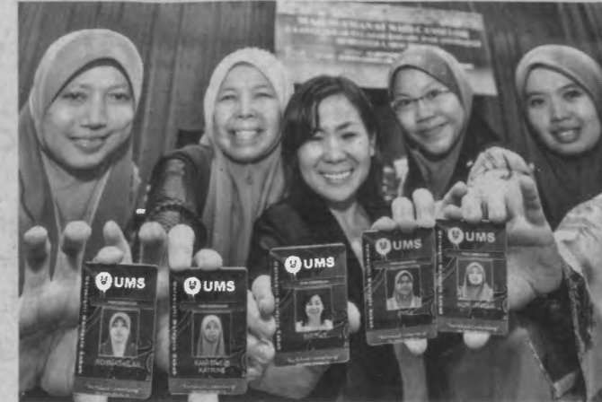
KAMI Pelajar Pascasiswazah UMS.

kepada semua warga UMS supaya dapat memainkan peranan dalam usahamencapai misi dan visi universiti.