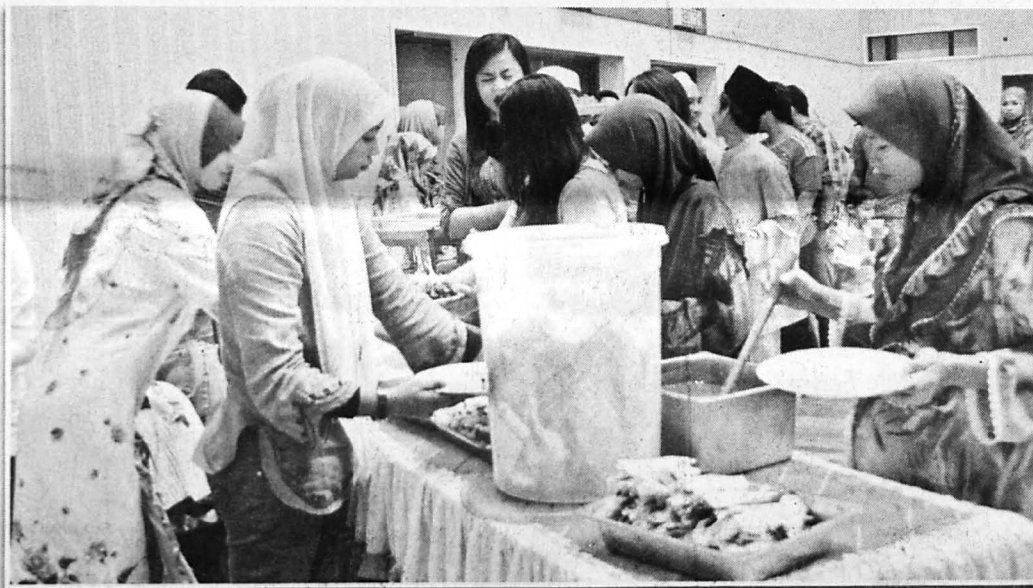
HADIRIN sedang menikmati juadah berbuka puasa.