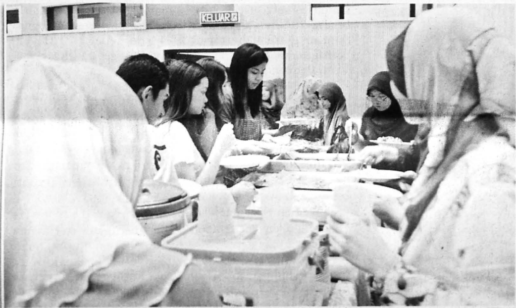
PARA alumni dan warga SPL beratur mengambil juadah untuk berbuka puasa.