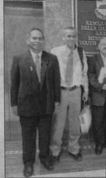
IMBAS kembali pembenta