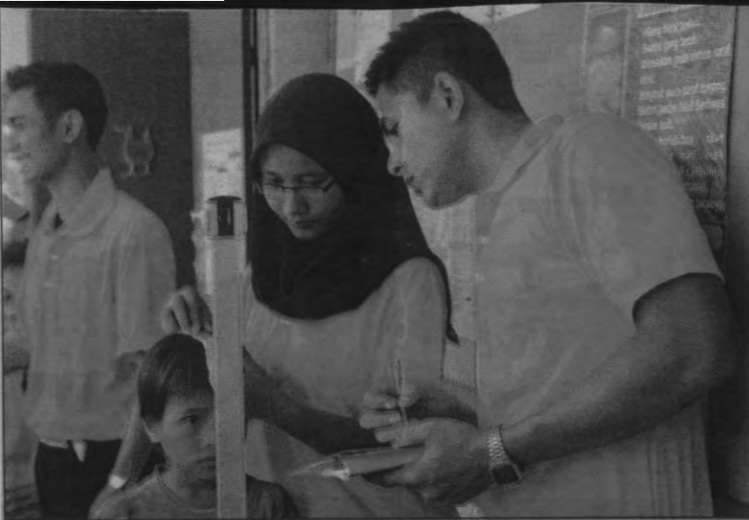
KAJIAN pencarian bakat di luar bandar Sabah akan turut dibentangkan di UISSCo2013.