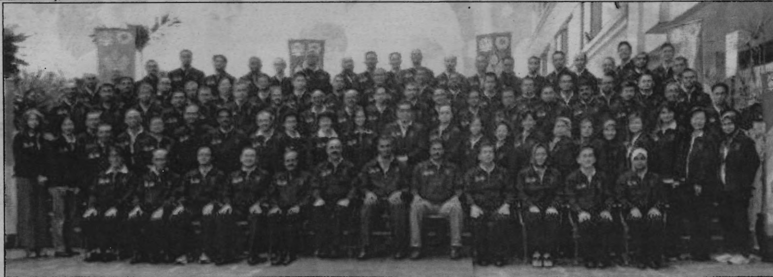
BARISAN Instruktur Kursus Sains Sukan negara yang bakal menyertai UISSCo2013.