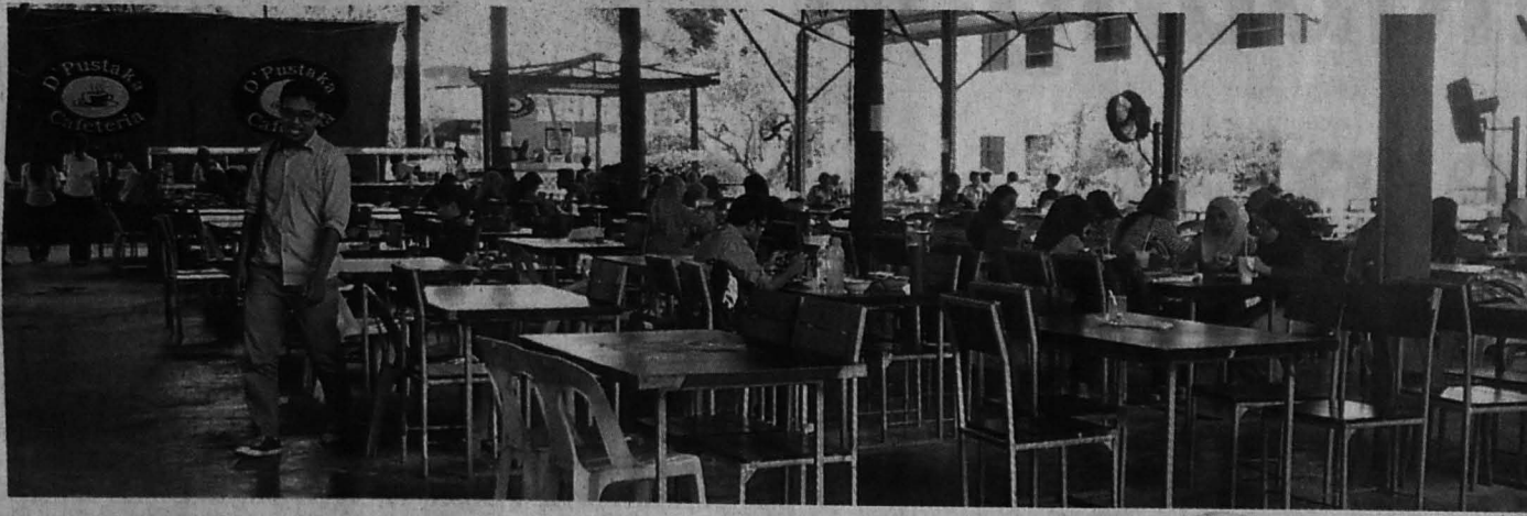
KEADAAN Pustaka Kafe yang sesak dengan mahasiswa yang ingin mengisi perut selepas seharian berada di kelas. (gambar kanan bawah) Salah satu jenis hidangan yang ditawarkan di kafeteria.

Menariknya, kafe atau tempat makan sinonimnya adalah tempat untuk menjamu selera. Ia juga dijadikan tempat perjumpaan bagi mahasiswa dan mahasiswi serta ibu bapa yang ingin melawat