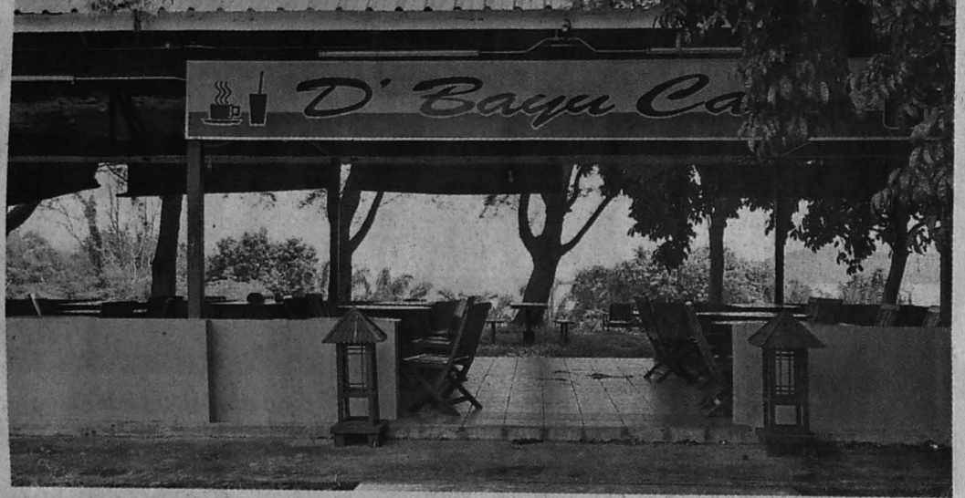
CAFE D'Bayu yang sering mendapat kunjungan terutamanya pada waktu senja.