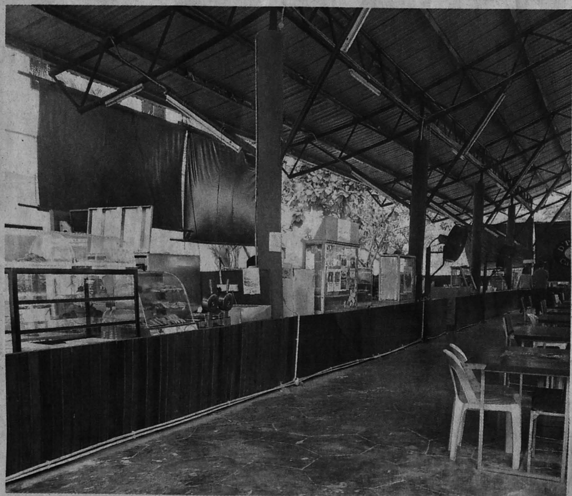
BARISAN gerai yang ada di Pustaka Cafe menghidangkan juadah makanan yang sihat serta lazat.

"Bagi yang merindui makanan kampung halaman, di Pustaka Kafe juga ada menyediakannya. Dengan ini, sedikit sebanyak terubat rasa rindu akan kampung halaman," katanya.