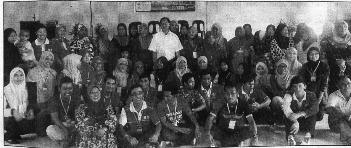
PESERTA DAN KELUARGA ANGKAT ... Kenangan Para Peserta bersama Keluarga Angkat.

Dalam pada itu, para penduduk kampung turut memuji usaha UMS yang telah berinisiatif mengadakan program tersebut dan berharap hubungan yang terjalin akan terus berkesinambungan dalam program-program lain di masa akan datang.