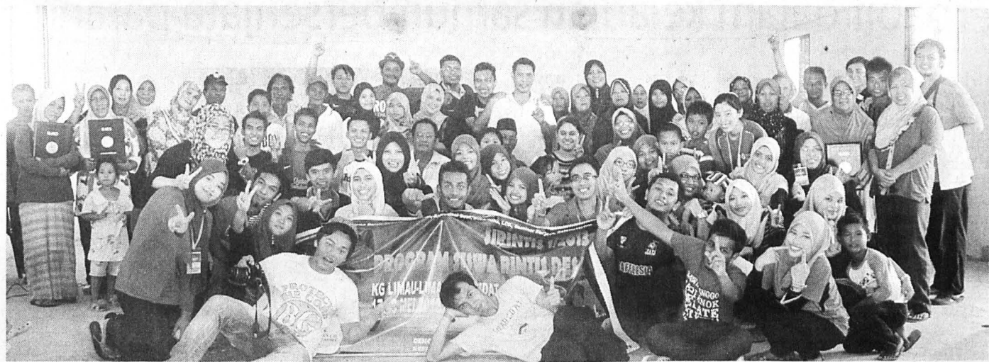
GAMBAR kenangan sebelum berpisah.

Sekali lagi para penduduk berkumpul menyertai acara sukaneka. Sukaneka diadakan bagi merapatkan lagi hubungan kekeluargaan di antara para peserta dengan penduduk kampung melalui kerjasama