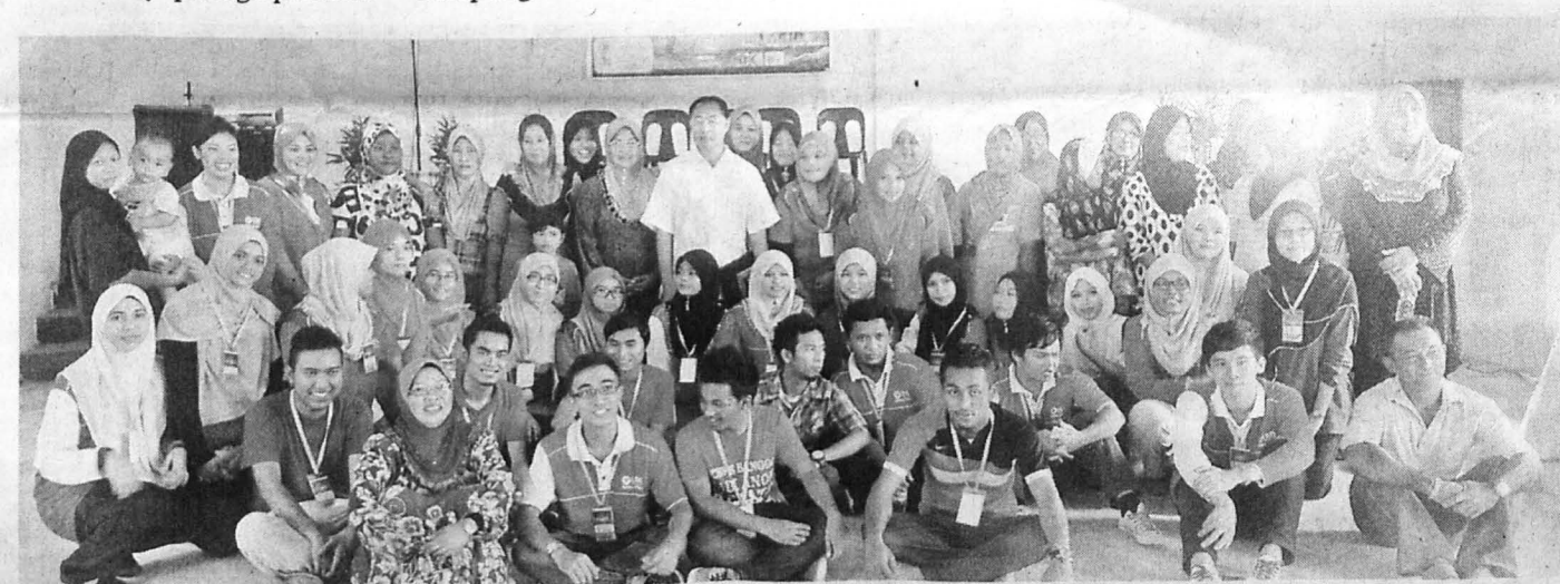
KENANGAN para peserta bersama keluarga angkat.

Dalam pada itu, para penduduk kampung turut memuji usaha UMS yang telah berinisiatif mengadakan program itu dan berharap hubungan yang terjalin akan terus berkesinambungan dalam program-program lain di masa akan datang.