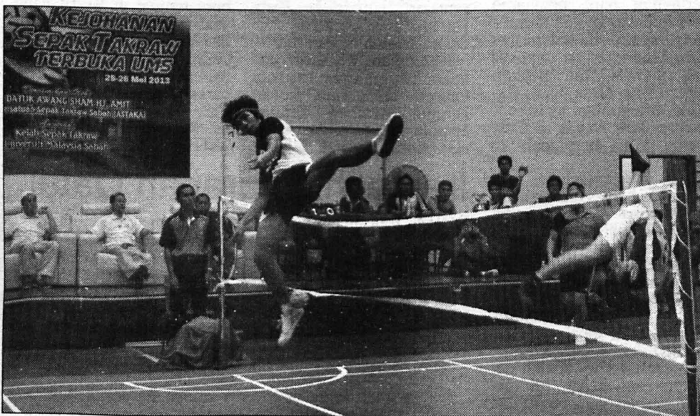
AKSI Aksi perlawanan akhir Papar A (kanan) menentang Brunei 88 B (kiri).