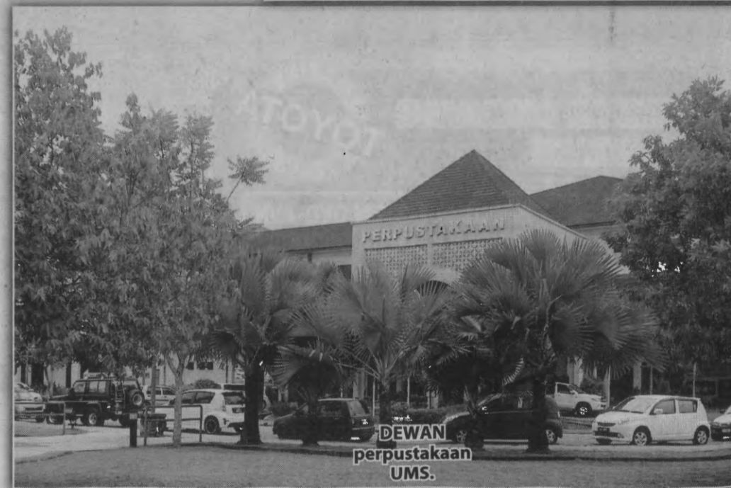
DEWAN perpustakaan UMS.