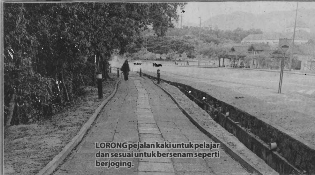
LORONG pejalan kaki untuk pelajar dan sesuai untuk bersenam seperti berjoging.

“Pemantauan juga dilakukan oleh pihak pengurusan bagi memastikan landskap sentiasa tersusun rapi dan menepati piawaian yang ditetapkan,” katanya.