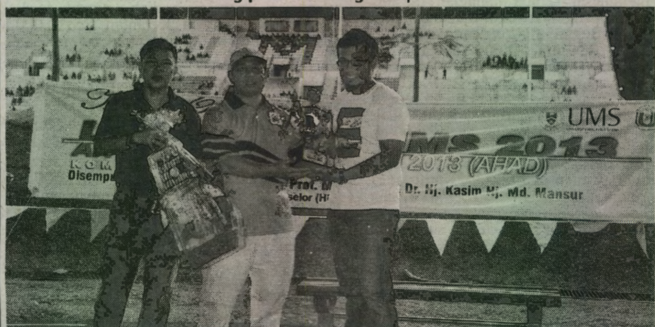
WAKIL peserta menerima hadiah kemenangan pasukan mereka.