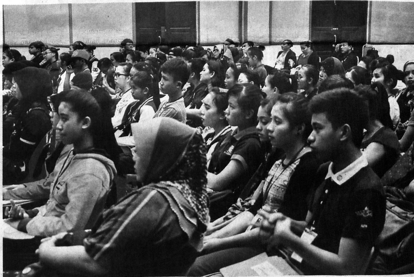
SEBAHAGIAN peserta yang menyertai Bengkel Koreografi Tari 2013.