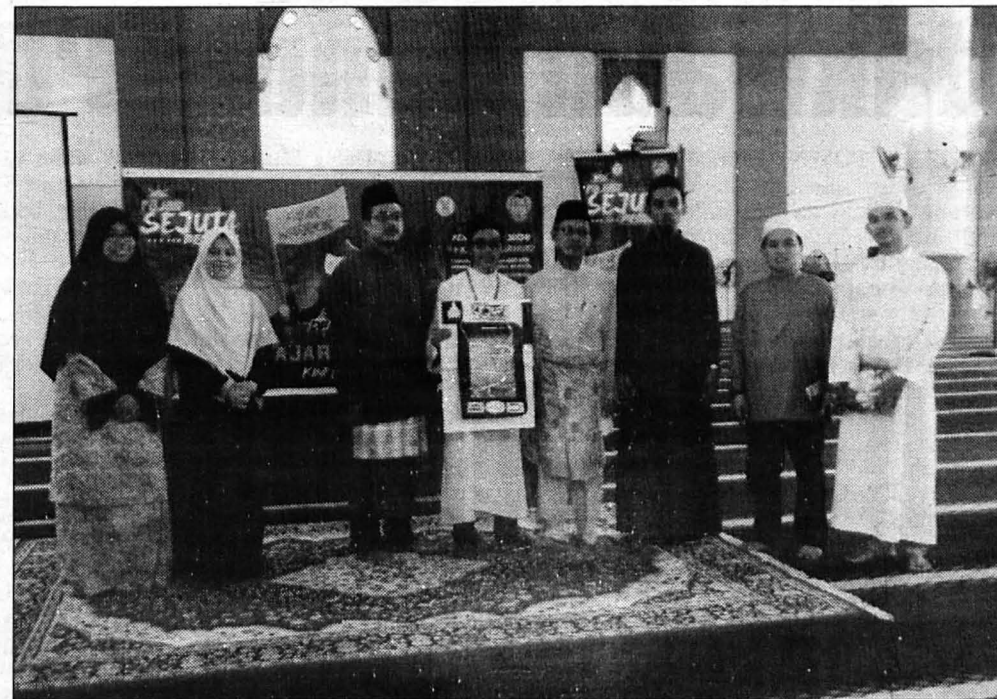
PROGRAM Fajar Sejuta Pemuda yang dianjurkan pihak YDKMM di Universiti Malaysia Sabah (UMS)

SPECIAL IFTAR FOR ASNAF atau SI4U ini merupakan salah satu program bakti masyarakat yang dianjurkan oleh YDKMM