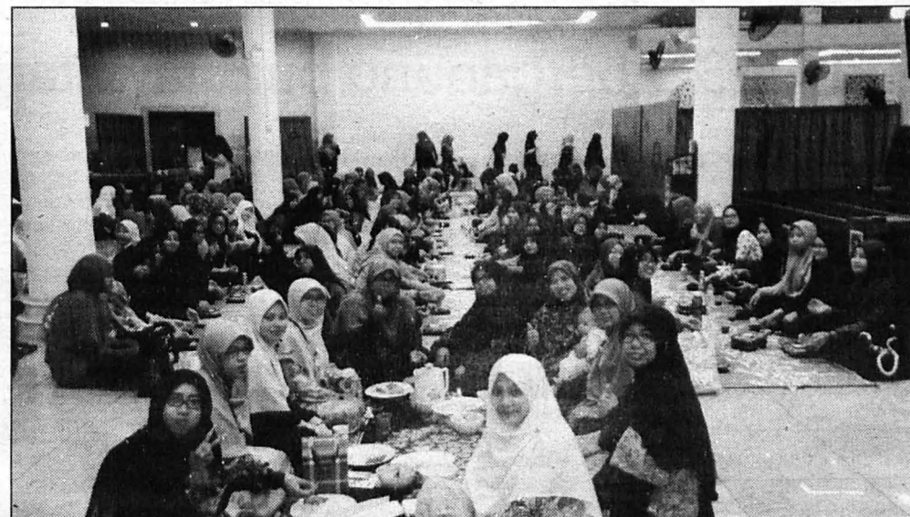
SUNGKAI ... YDKMM turut mengadakan Special Iftar for Asnaf kepada 400 orang golongan Asnaf di UMS.