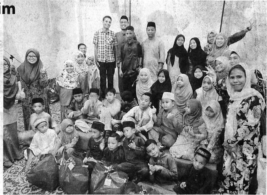
PSA rai anak yatim dari tujuh sekolah di sekitar Kota Kinabalu.