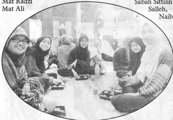
MAHASISWI UMS pada program berkenaan.