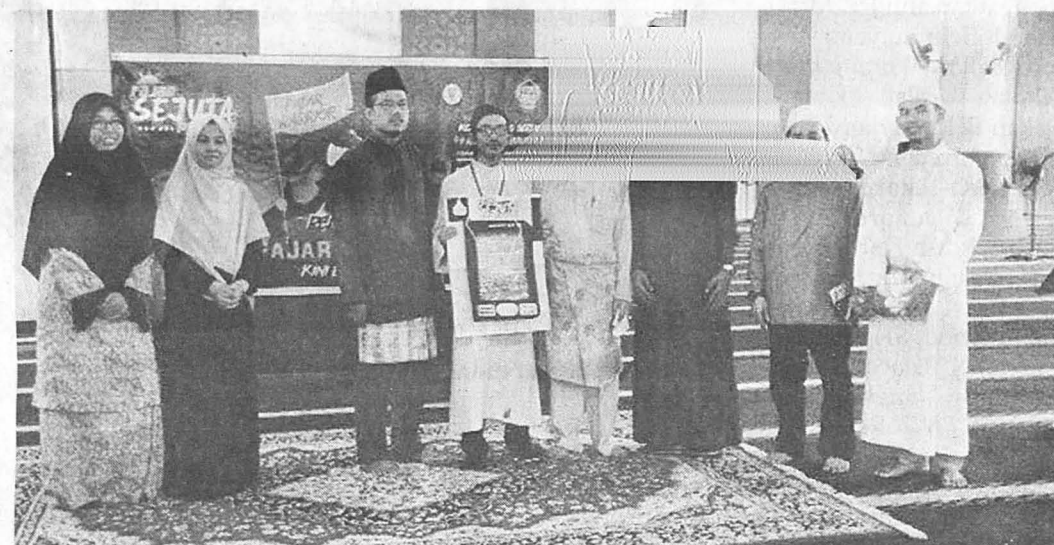
TETAMU kehormat yang hadir merakam gambar kenangan pada program Fajar Sejuta Pemuda.

Majlis juga diserikan dengan hidangan jamuan berbuka puasa bersama-sama pelajar UMS dan