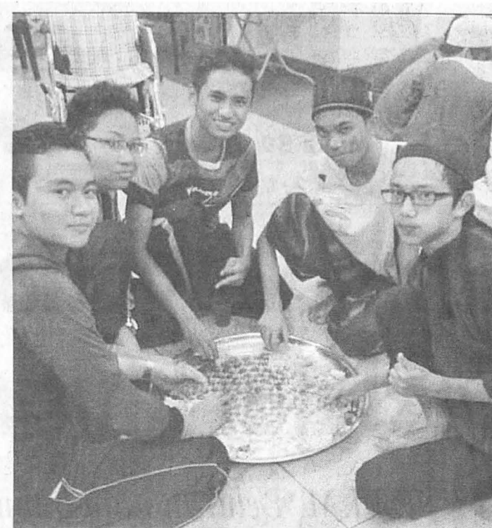
(Gambar atas) KELIHATAN mahasiswa UMS sahur bersama-sama.