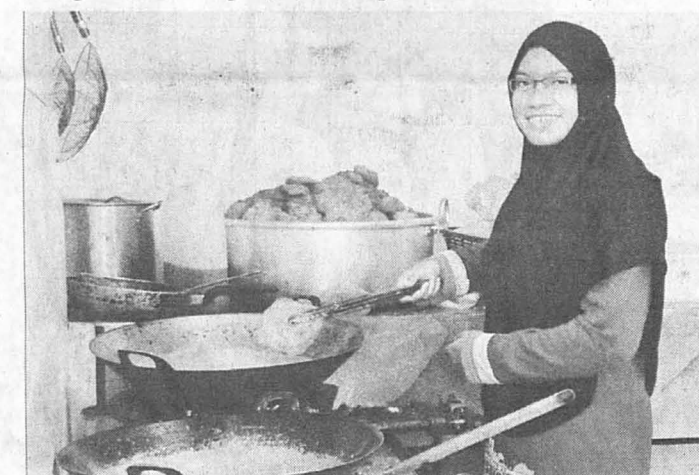
SESI penyediaan makanan Iftar Mega.

Pemuda dapat membantu terutamanya dalam kalangan mengimarahkan lagi masjid para belia khususnya.