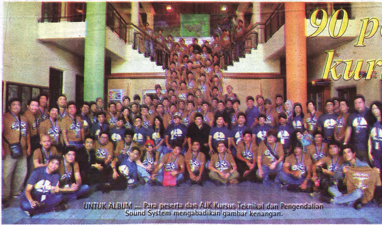
UNTUK ALBUM .... Para peserta dan AJK Kursus Teknikal dan Pengendalian Sound System mengabadikan gambar kenangan.