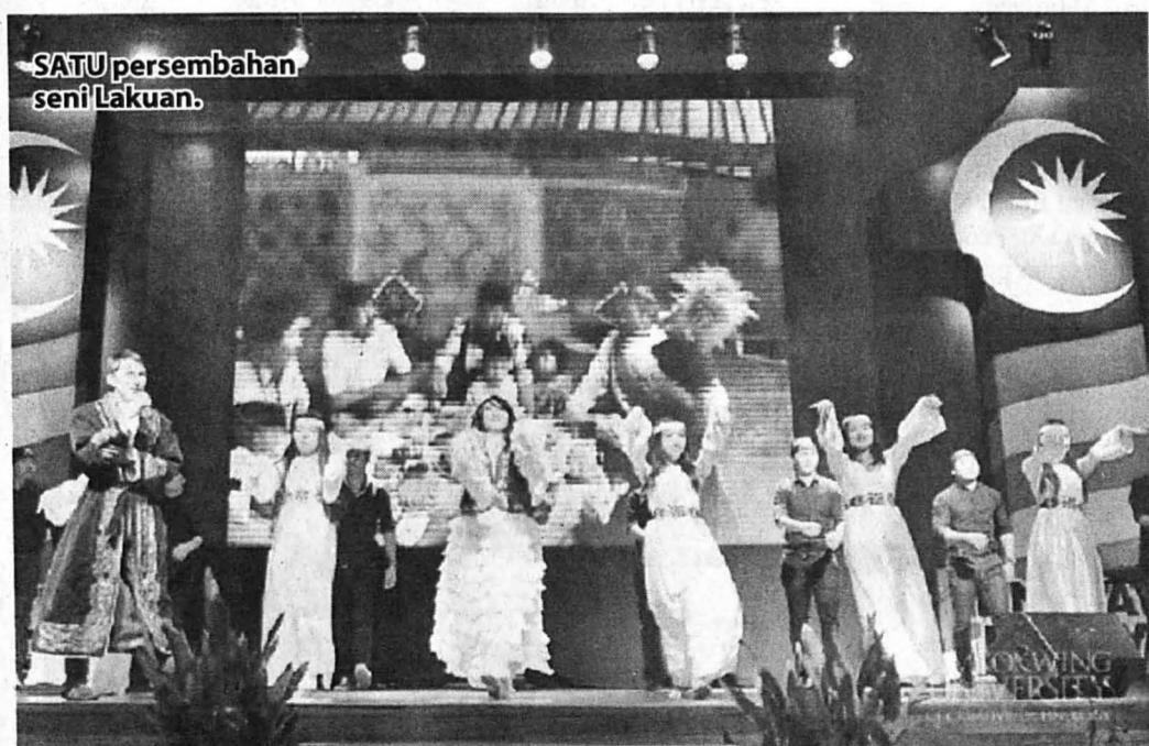
SATU persembahan seni Lakuan.

***PENULIS merupakan Pensyarah Seni Visual, Fakulti Kemanusiaan, Seni dan Warisan di Universiti Malaysia Sabah (UMS).***