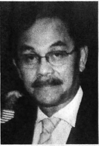
CATATAN KANVAS KOYAK