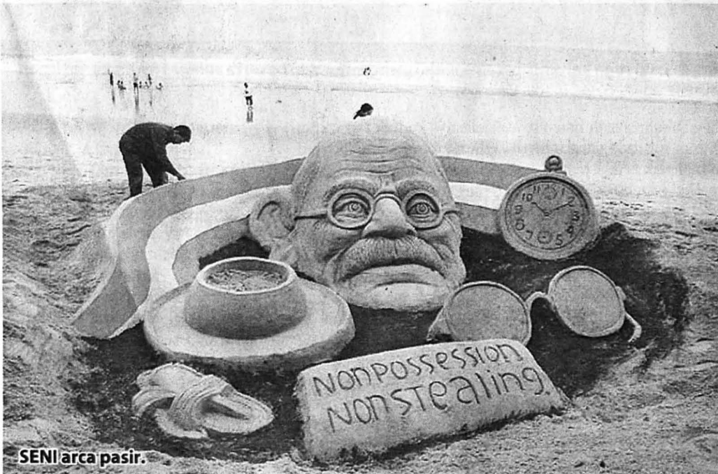
SENI arca pasir.