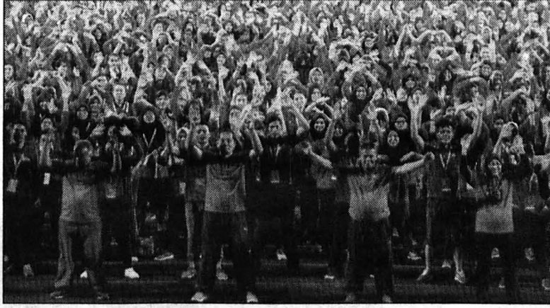
BERSEMANGAT .... Siswa-siswi baharu UMS membuat barisan yang membentuk logo “Soaring Upwards”.

“Kemudahan ini juga merupakan ruang latihan bagi pelajar ‘senior’ di UMS yang telah berjaya mengharumkan nama UMS di per-