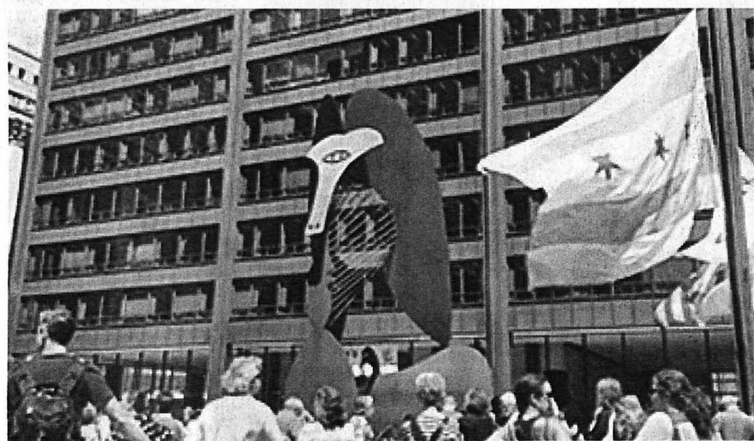
PELANCONG berkunjung di arca Picasso.

***PENULIS merupakan Pensyarah Seni Visual, Fakulti Kemanusiaan, Seni dan Warisan di Universiti Malaysia Sabah (UMS).***