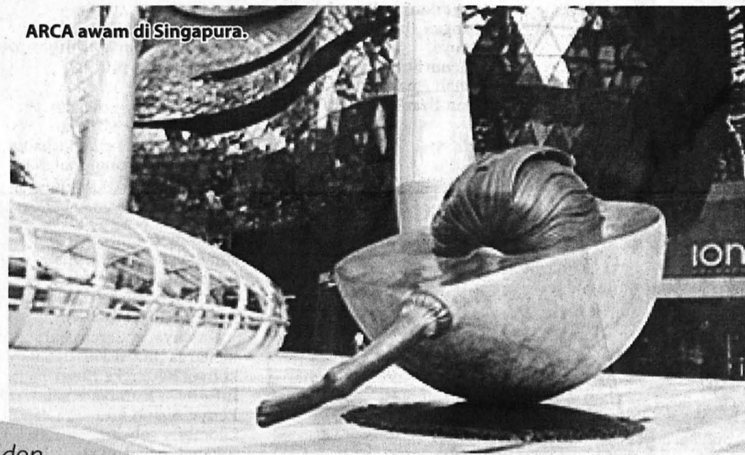
ARCA awam di Singapura.

seni yang akan diadakan bagi pertama kalinya, Lembaga Pembangunan Seni Visual Negara dan Kementerian Pelancongan akan mengadakan Kuala Lumpur Art Biennale pada 1 November hingga 18 Mac 2018. Biennale adalah seni berskala mega dan bertaraf antarabangsa dan ia juga didapati menjadi penanda aras budaya nasional sesebuah negara yang berdaya saing.