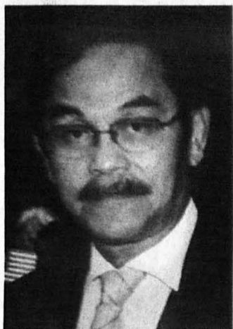
CATATAN KANVAS KOYAK