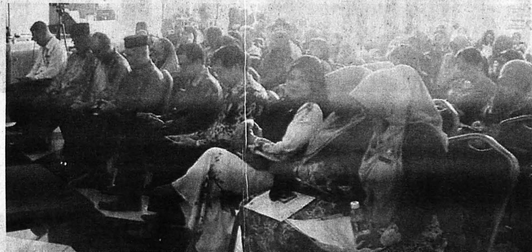
SEBAHAGIAN daripada ratusan warga JPNS yang menghadiri majlis itu di lobi Wisma JPNS di Likas.