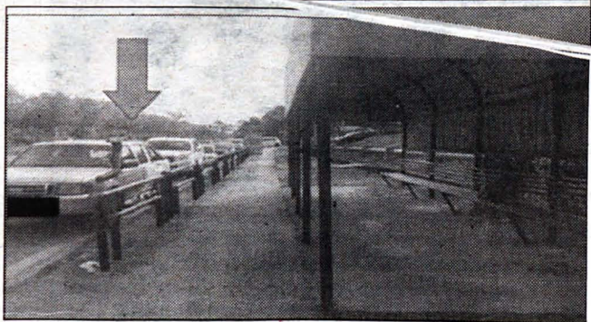
Perhentian bas di depan City Mall menjadi tempat meletak kenderaan pengguna City Mall (arrow warna pink).

Keseluruhan kekerapan Bas Sedia Ada di Laluan Utama menuju ke Pusat Bandaraya Kota Kinabalu. Kekerapan Perkhidmatan Bas Berhenti-henti di Laluan Utama Menuju ke Pusat Bandar raya Kota Kinabalu. Kekerapan Perkhidmatan Bas Mini di Laluan Utama Menuju ke Pusat Bandar raya Kota Kinabalu.