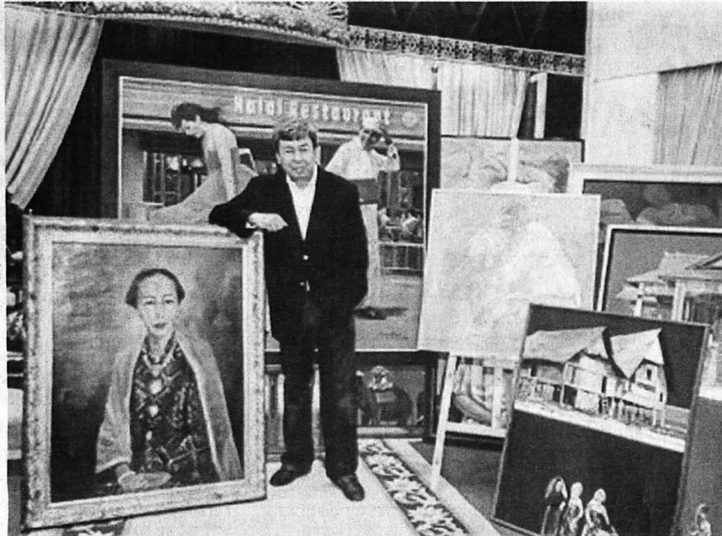
KDYMM Sultan Selangor dengan koleksi lukisannya.

Menurut sejarah seni pada zaman purba, seni ditampung oleh masyarakat yang membiayai pelukis untuk tujuan spiritual bagi kesinambungan kehidupan serta hayat kepercayaan animisme komuniti mereka. Apabila manusia sudah bertamadun maka kolektor mereka adalah pihak agama