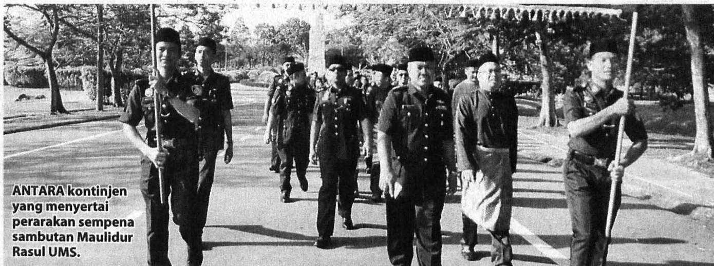
ANTARA kontinjen yang menyertai perarakan sempena sambutan Maulidur Rasul UMS.

Sambutan berkenaan disertai seramai 500 orang peserta yang mewakili 17 buah kontinjen.