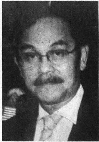
CATATAN KANVAS KOYAK