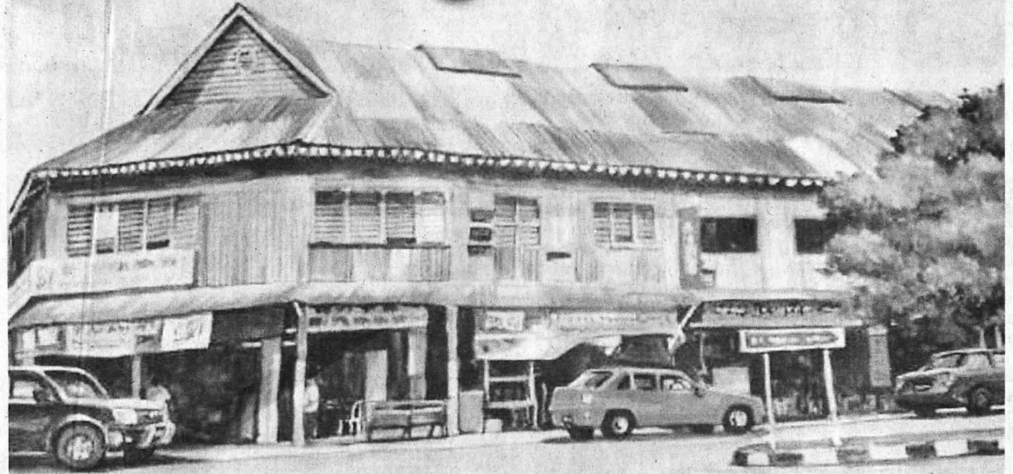
LUKISAN Pekan Bongawan.

Walaupun dalam keadaan kesihatan yang tak mengizinkan, semangat beliau sangat kuat untuk menghasilkan karya setiap hari tanpa jemu. Bukan