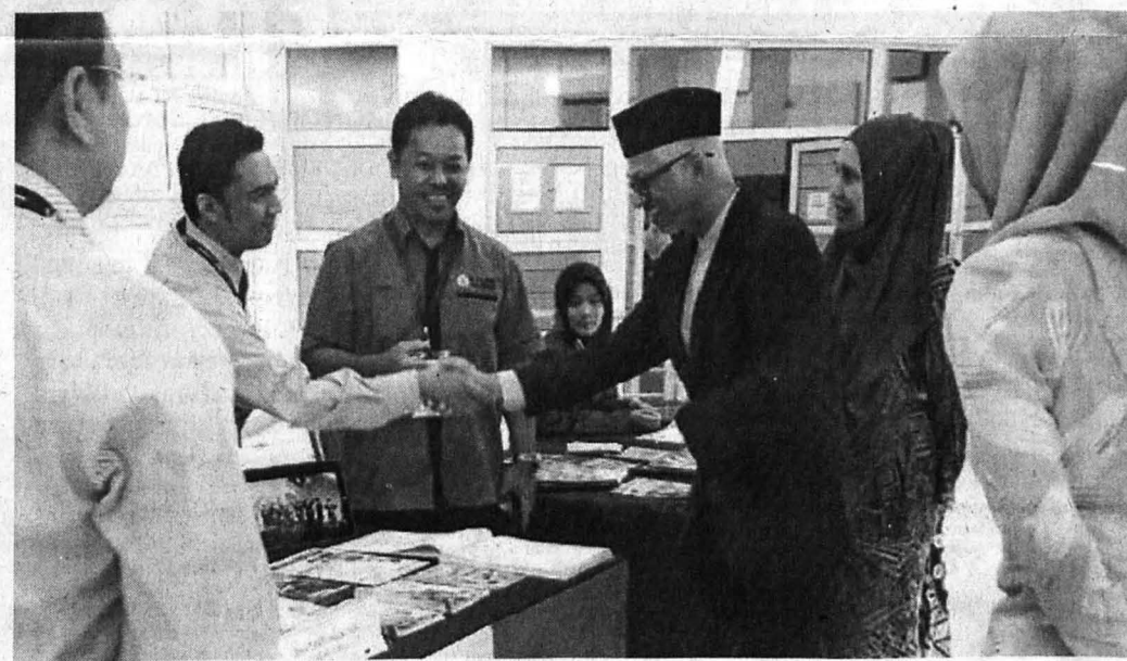
LAWATAN tetamu kehormat majlis ke meja pameran UMS.

Inilah antara lain kenapa universiti-universiti di kepulauan Borneo ini perlu mewujudkan satu kerangka kerja yang tersusun, kemas dan teratur serta holistik sifatnya merentas sempadan negara. - Artikel sumbangan oleh JAKARIA DASAN