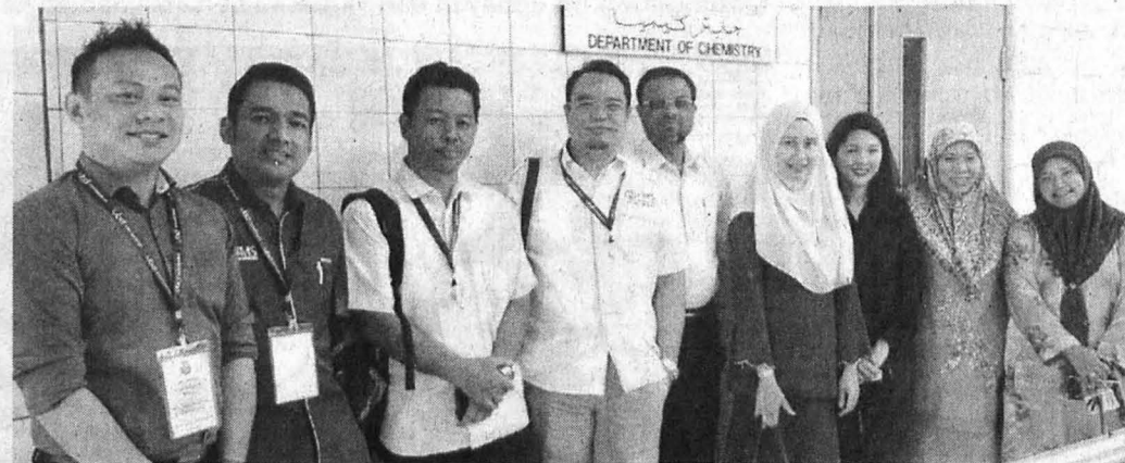
GAMBAR kenangan bersama pensyarah UBD.

Dalam hubungan ini, maka UMS yakin bahawa ia akan dapat mencapai objektif yang dihasratkan UBD itu. Selain mampu menawarkan program-program yang setara oleh fakulti, pusat dan institut, UMS menerusi aktiviti pengajaran dan pembelajaran turut memberi peluang kepada para pelajar untuk berinteraksi dan berkomunikasi secara langsung dengan