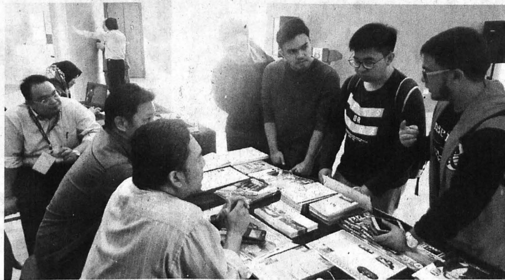
PELAJAR bertanya mengenai program yang ditawarkan oleh UMS.

Discovery Year 2018 atau dikenali sebagai DY 2018 adalah inisiatif UBD bagi memberi peluang