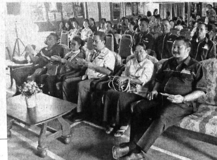
ANTARA tetamu kehormat yang hadir.