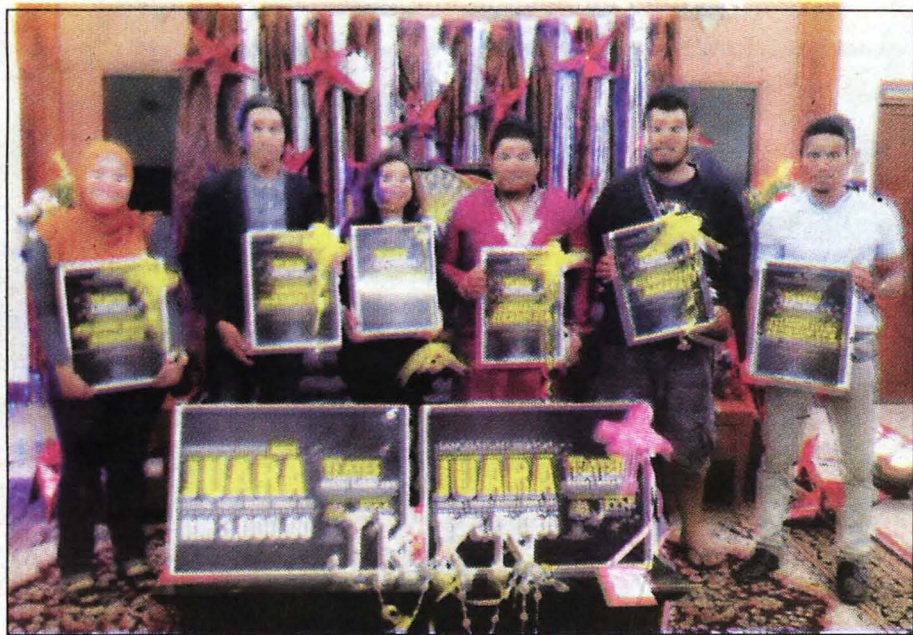
ALBUM ... Kemenangan 'Mambo Horse' hasil kerja keras krew bergambar kenangan bersama selepas dinobatkan sebagai juara Festival Teater Negeri Sabah 2017.