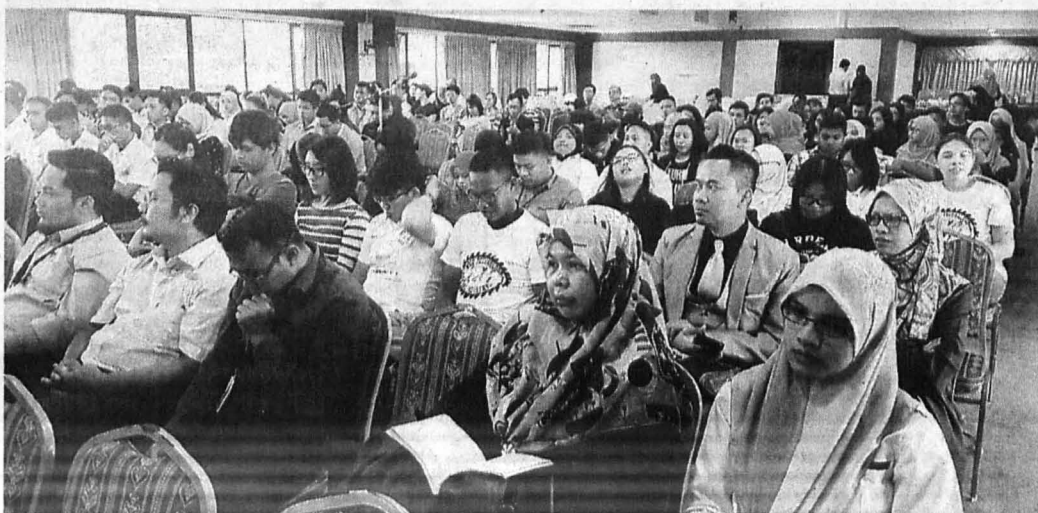
ANTARA peserta yang terdiri daripada pelajar UMS dan beberapa wakil dari institusi pengajian tinggi awam dan swasta yang hadir pada program berkenaan.

Terdahulu, seramai lima panel profesional reka bentuk perabot yang diundang khas dari luar negara hadir pada program berkenaan.