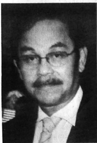
CATATAN KANVAS KOYAK