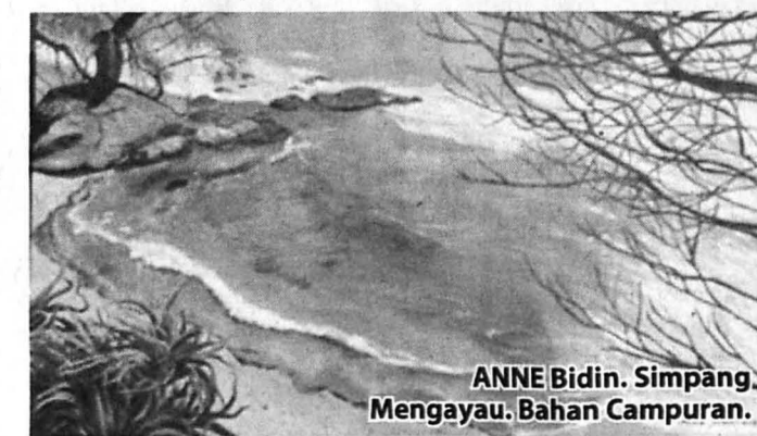
ANNE Bidin. Simpang Mengayau. Bahan Campuran.

Usaha yang dijalankan oleh kumpulan Kelasi adalah sangat baik kerana di samping menekankan kepada konsep berdiskusi di kalangan pelukis dan tidak mengharapkan bantuan pihak berkuasa mereka menggembungkan usaha mempertingkatkan promosi seni lukis dan pemasaran karya di kalangan masyarakat tempatan dan pelancong melalui berbagai-bagai kaedah teknologi moden umpamanya mengadakan diskusi, forum, seminar, konsert muzik, puisi, lakonan dan sebagainya. Ini adalah satu kesedaran alternatif yang patut di tanamkan kepada setiap seniman di samping berkarya mereka juga perlu mendidik khalayak agar cenderung menyokong seni sebagai identiti serta karakter bangsa dan negara.