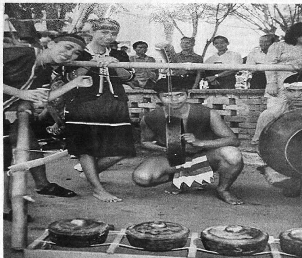
SEMASA acara tarian di Tenom.

menjelajah dunia dengan menari telah menghalusi keterampilan beliau bukan sahaja mengenali kepelbagaian jenis tarian antarabangsa yang mana telah mempelbagaikan citarasa tarian serta gerak ruang beliau sebagai penari. Setelah mencurahkan kemahiran menari selama hampir empat puluh tahun beliau akhirnya ingin menjadi seorang guru tari atau tokoh koreografi.