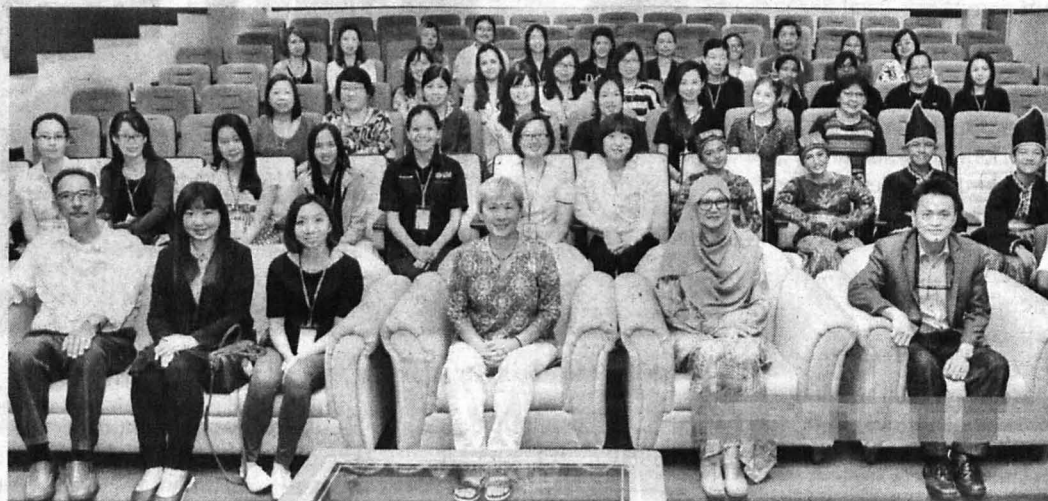
PARA peserta bengkel yang menghadiri Early Childhood Music Level II.

Seramai 36 peserta dari Sabah dan Semenanjung Malaysia serta lima peserta luar negara iaitu Macao, Korea, Guangzhou dan Brunei yang menghadiri bengkel itu bermula 16 hingga 20 Julai 2018.