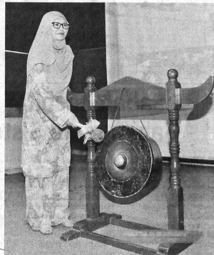
DZURIZAH merasmikan Bengkel Early Childhood Music Level II.

“Di samping itu, guru muzik dapat meningkatkan kefahaman perkembangan muzik awal kanak-kanak melalui aktiviti pergerakan badan.