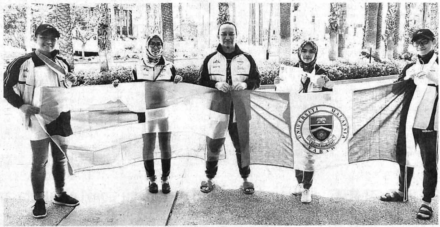
PELAJAR UMS yang mengharumkan nama negara di Amerika Syarikat bersama penyelarar pasukan.

UB 3.P.2018.133 UNIVERSITI Malaysia Sabah (UMS) berjaya membawa pulang satu emas, tiga perak dan satu gangsa dalam satu pertandingan World Championships of Performing Arts (WCOPA) yang diadakan di Long Beach California, Los Angeles, Amerika Syarikat, Julai lepas.